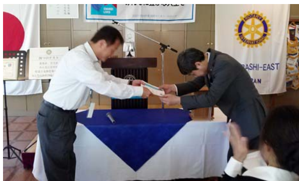
ロータリークラブセントラル賞 受賞